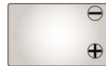
Тип клемм F2